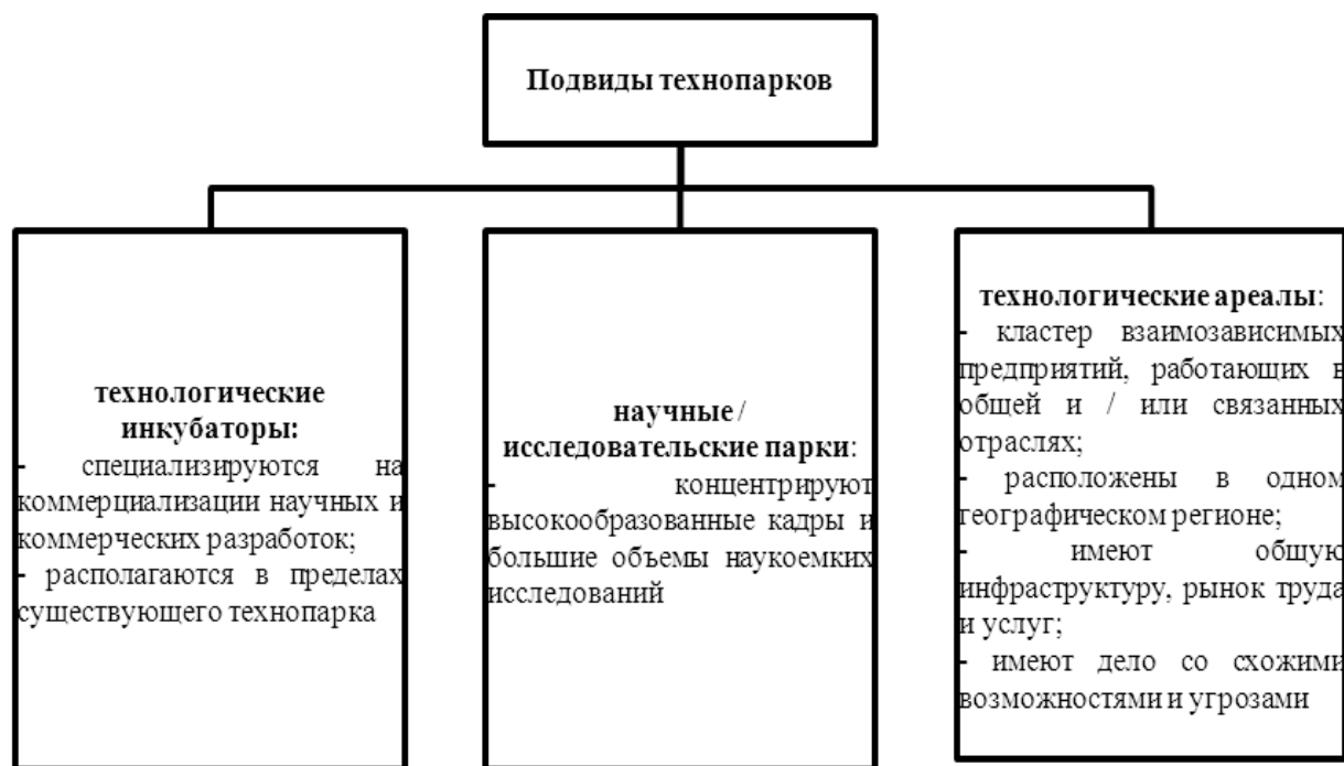
Рис. 1. Существенные признаки технопарков

ных актов, стимулирующих деятельность технопарков; определение государственных заказов на создание инновационных продуктов.