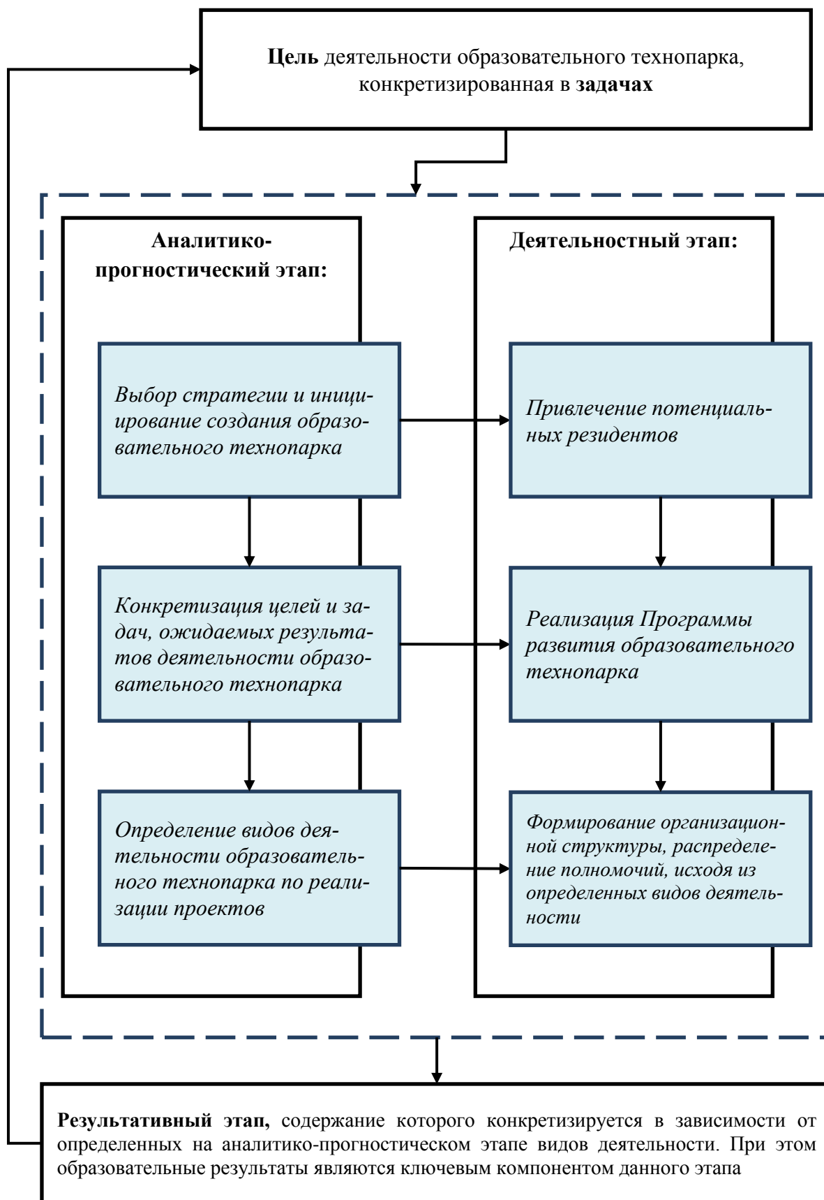
Рис. 3. Структурная композиция образовательного технопарка